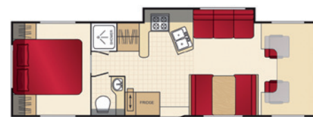
Floorplan C 30 (Grundriss Tag)